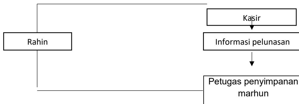
tabel 3. pelunasan